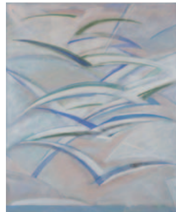
Gabbiani in volo, 1983

Il 17 aprile del 2004 muore alla età di 93 anni: le sue ceneri sono collocate al Cimitero di San Michele a Venezia.